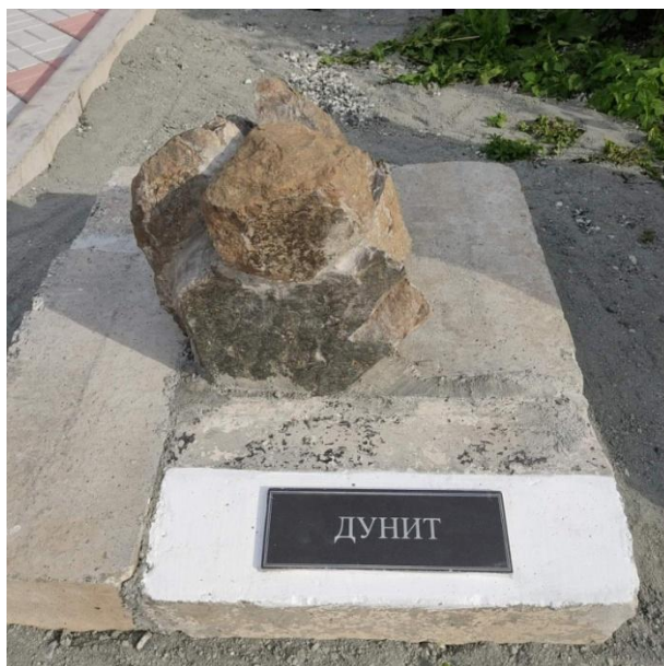
Дунит-главный источник платины