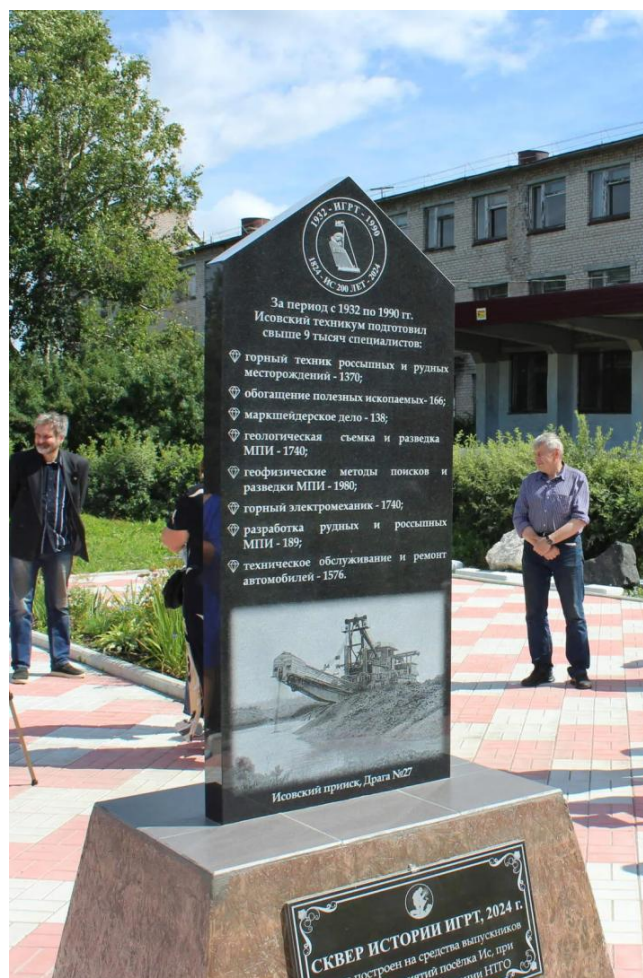
Тыльная сторона стелы