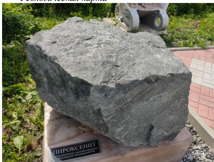
Клинопироксенит титано-магнетитовая руда, подарок Качканарского ГОК