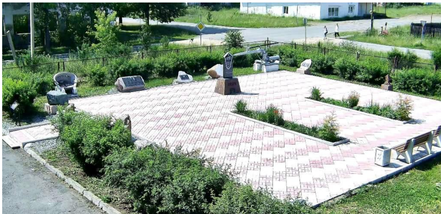
Вид сквера сверху

При входе в сквер с левой стороны между дражным ковшом и гидромонитором расположены 4 плиты из долерита с основными вехами истории геологоразведочного техникума в период с 1932 по 1990 гг., памятный знак из долерита со списком участников Великой Отечественной войны ушедших из стен техникума, памятная доска из долерита о 200-летиИ Исовского прииска.