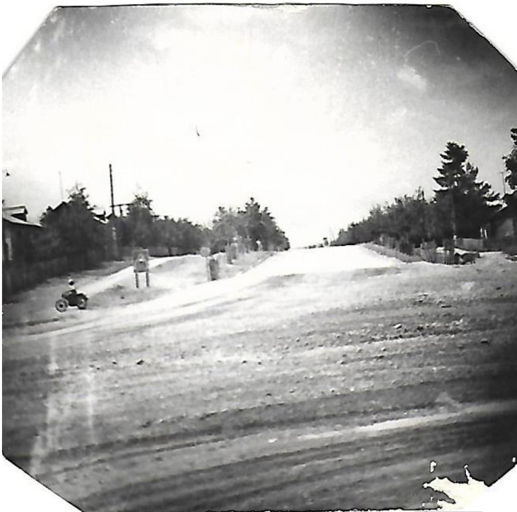
Улица Кирова со стороны Качканара в начале 70-х годов.