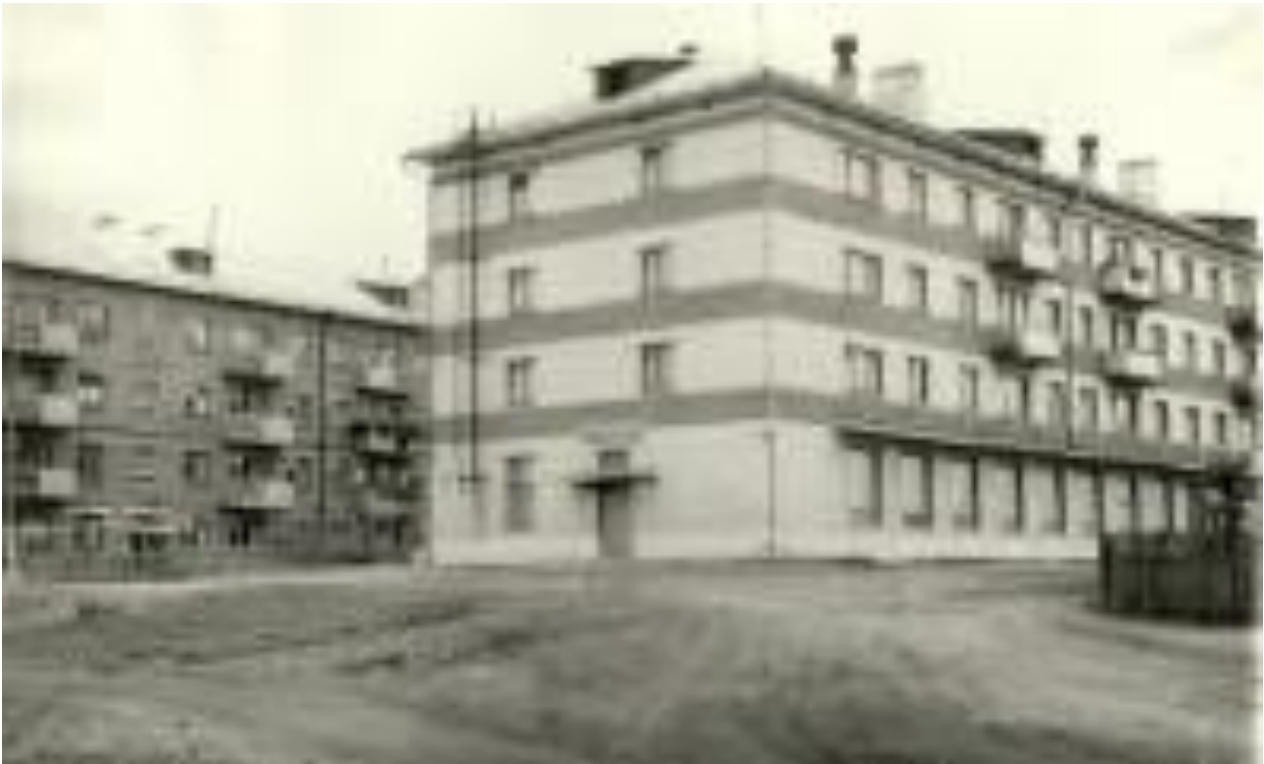
С 1972 года библиотека располагается в этом здании.