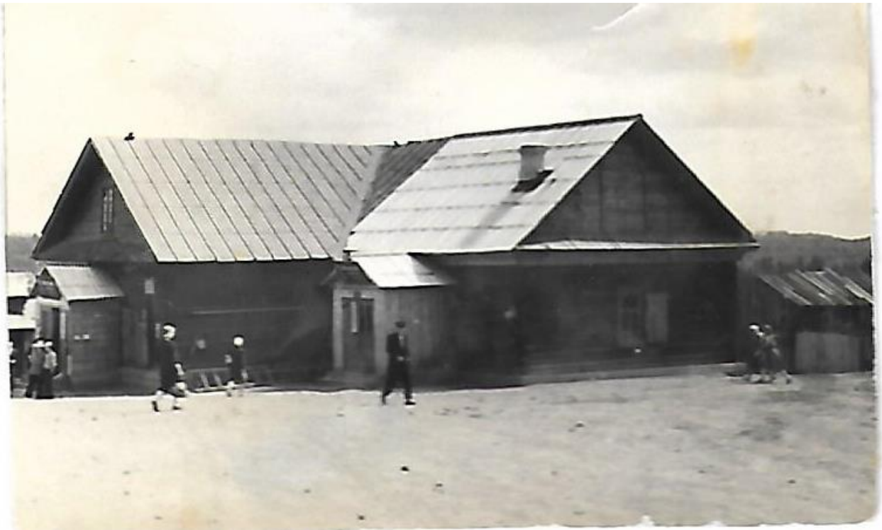
Магазин в 50-е годы.