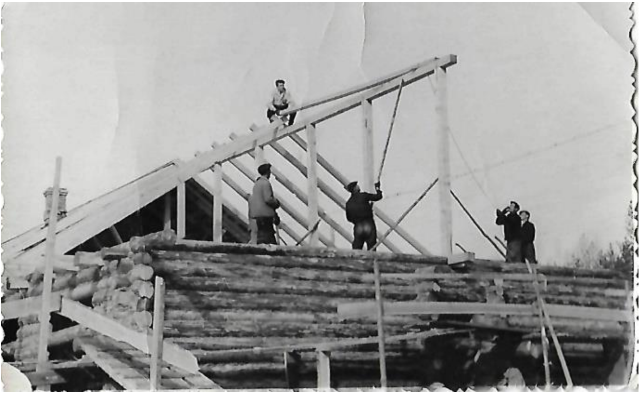
1959 год. В поселке строится лесопилка. Нужен лес и доски для строительства домов в г. Качканар.