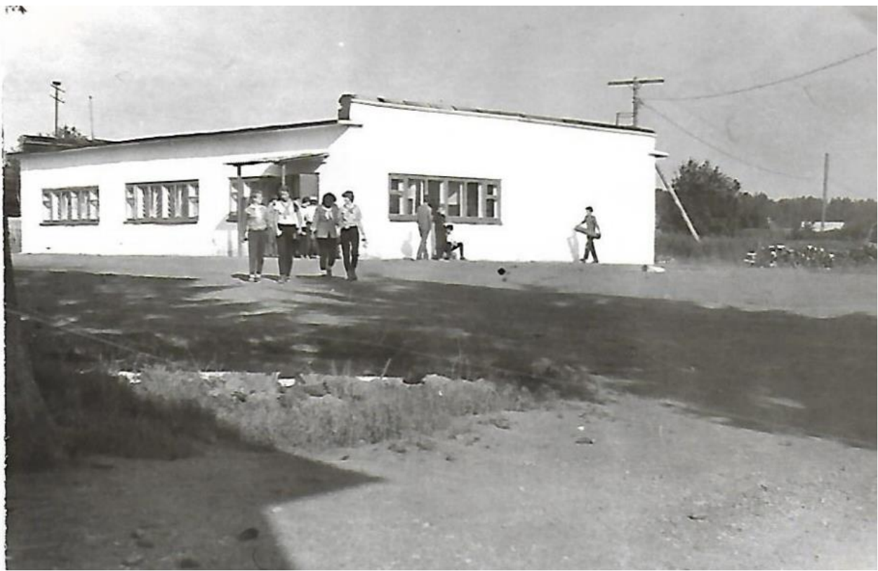
Открывается второй продуктовый магазин по улице Кирова в районе школы.