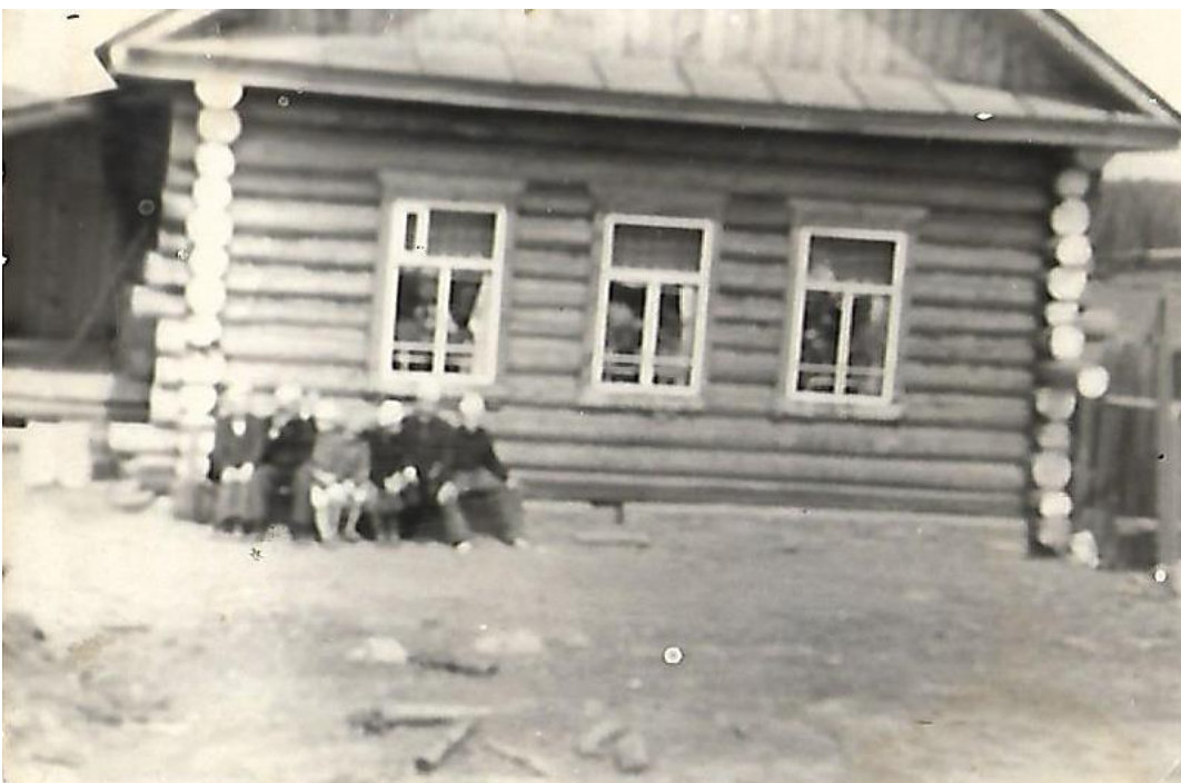
Первое здание поссовета (поселковой администрации).