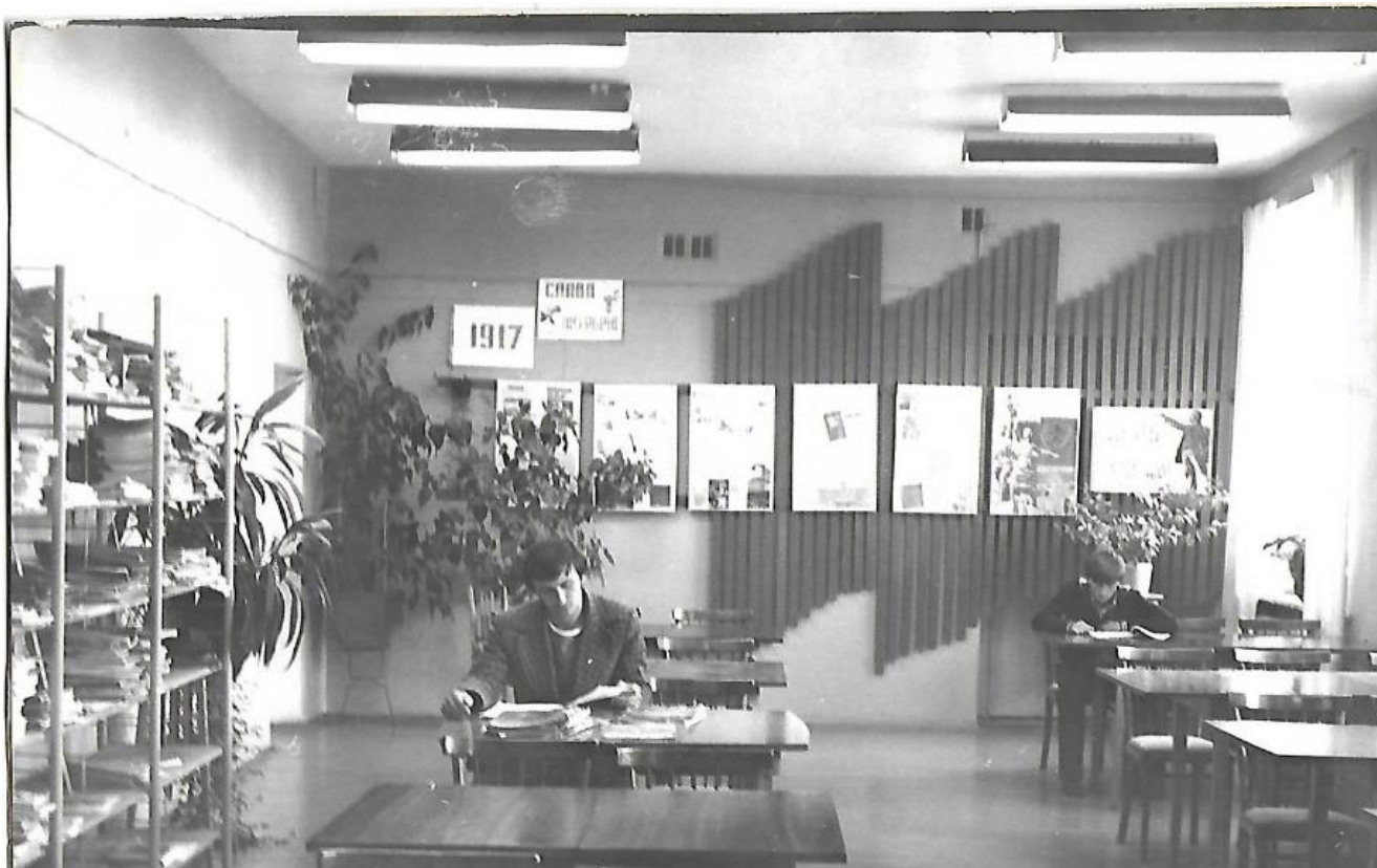
Библиотека. Новое здание.

Валериановская библиотека была одной из лучших поселковых библиотек в области.