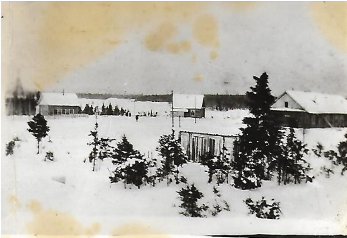
Первые дома появились вдоль реки