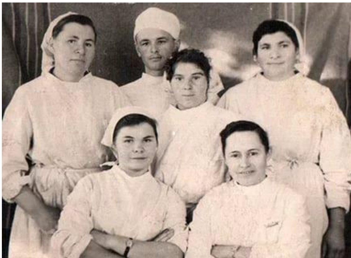
Первые врачи п. Валериановск.