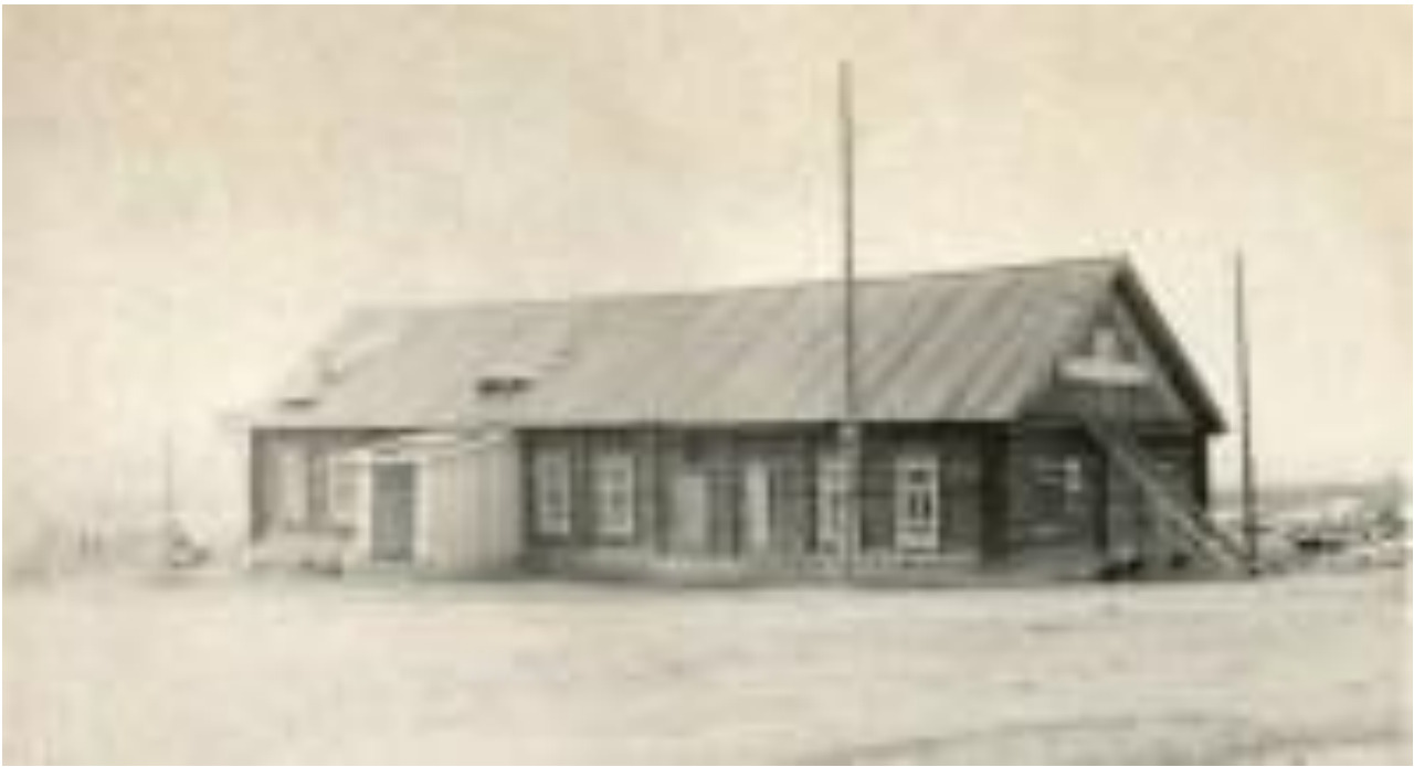
Здание клуба. В 1954 году в нём располагалась библиотека