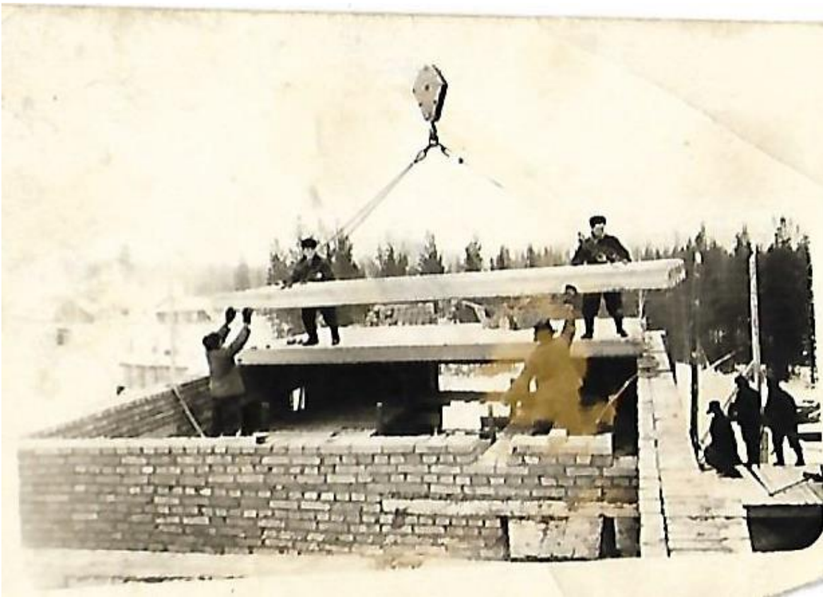
Строительство школы. На стройке работали жители Валериановска.