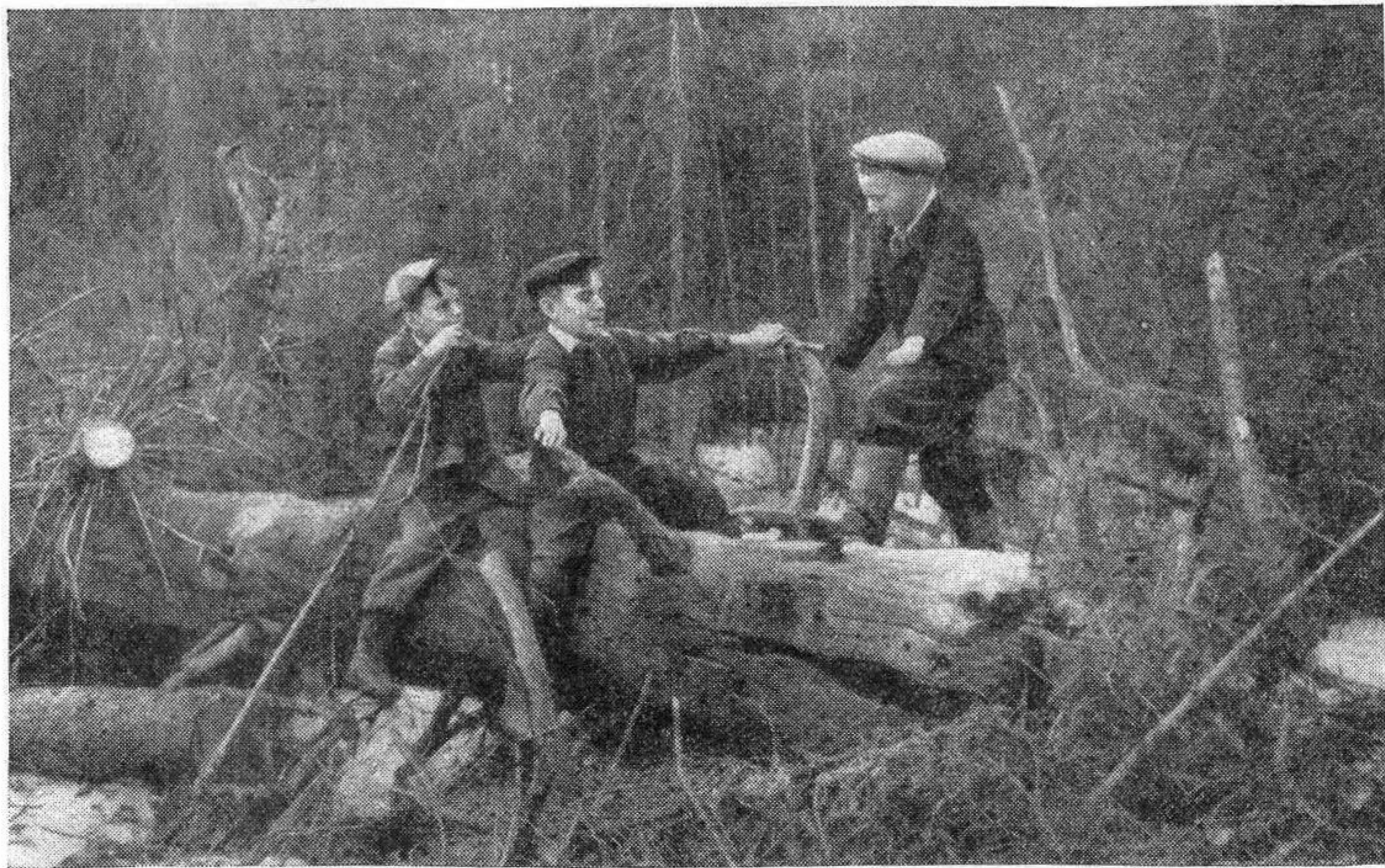
Выйдешь из школы, добежишь до конца улицы — и ты в тайге.

А попутчики спрашивали, как это она решилась променять на Качканар жизнь в большом и хорошем городе Свердловске, и рассказывали, какие замечательные массовки устраивают качканарцы по воскресеньям в тайге.