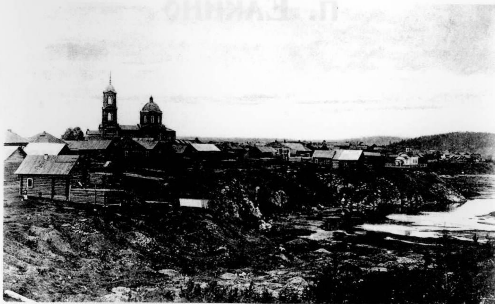
Окрестности Нижней Туры, п. Ёлкино

Храм действительно особенный, как и место его расположения. Да, места здесь священные, а природа – изумительной красоты.