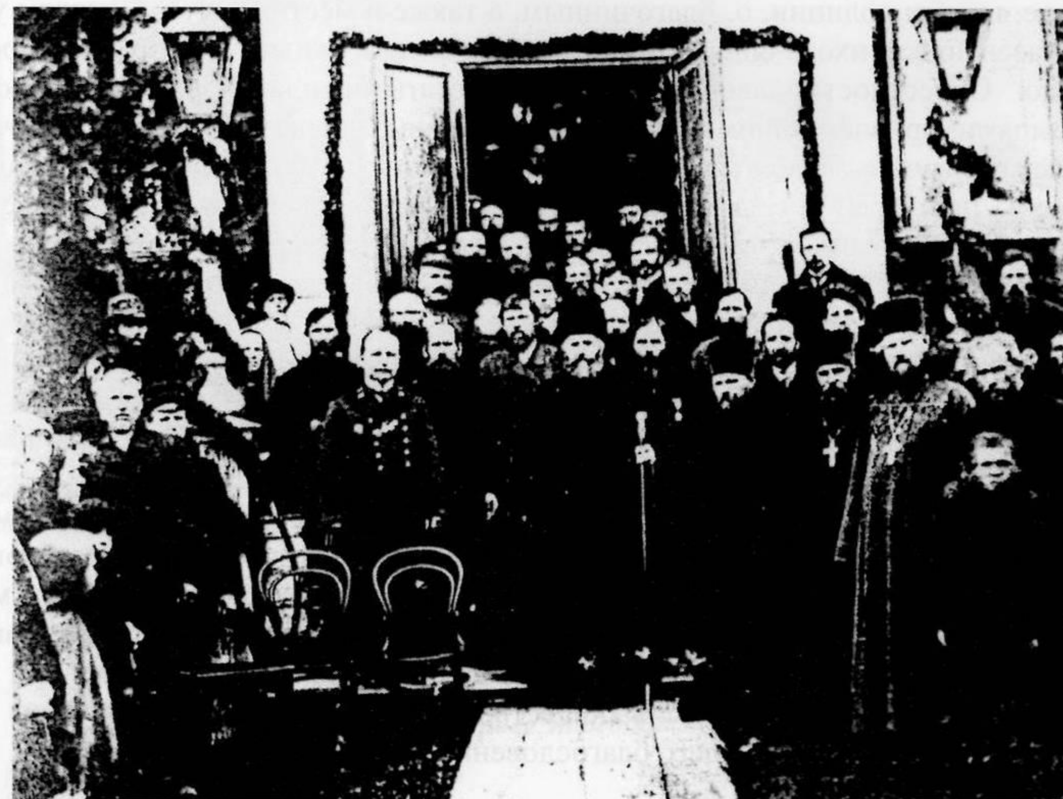
Освящение Ёлкинской Николаевской церкви. 9 сентября 1913 г.

«8 сентября, Его Преосвященство божественную литургию совершил в Нижне-Туринской Трехсвятительской церкви. Вечером в тот же день Его Преосвященством всенощное бдение совершено в Николаевской церкви дер. Ёлкиной.