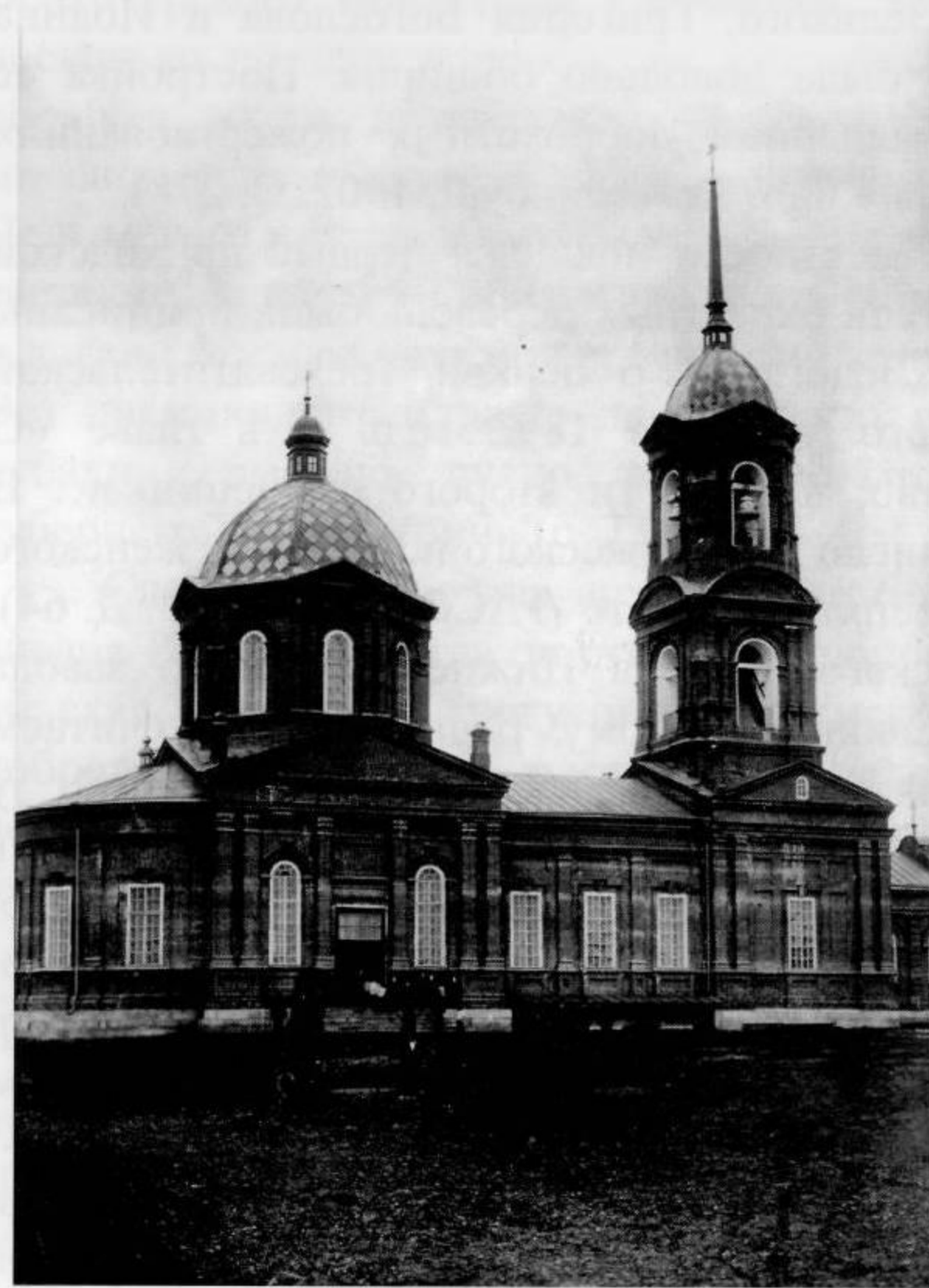
Николаевская церковь заложена в 1906 г.

У Кривощёкова И.Я. в «Словаре Верхотурского уезда» читаем: «Елкинское сельское общество, продавши часть покосов для выработки платины, выручило около 250 тысяч рублей, в наличности от этого капитала остается в настоящее время около 180 тысяч рублей. Дворов в селении 176, в них жителей обоюго пола 998 человек, по сведениям 1908 г. Верхотурского уездного земства» (с. 399–400).