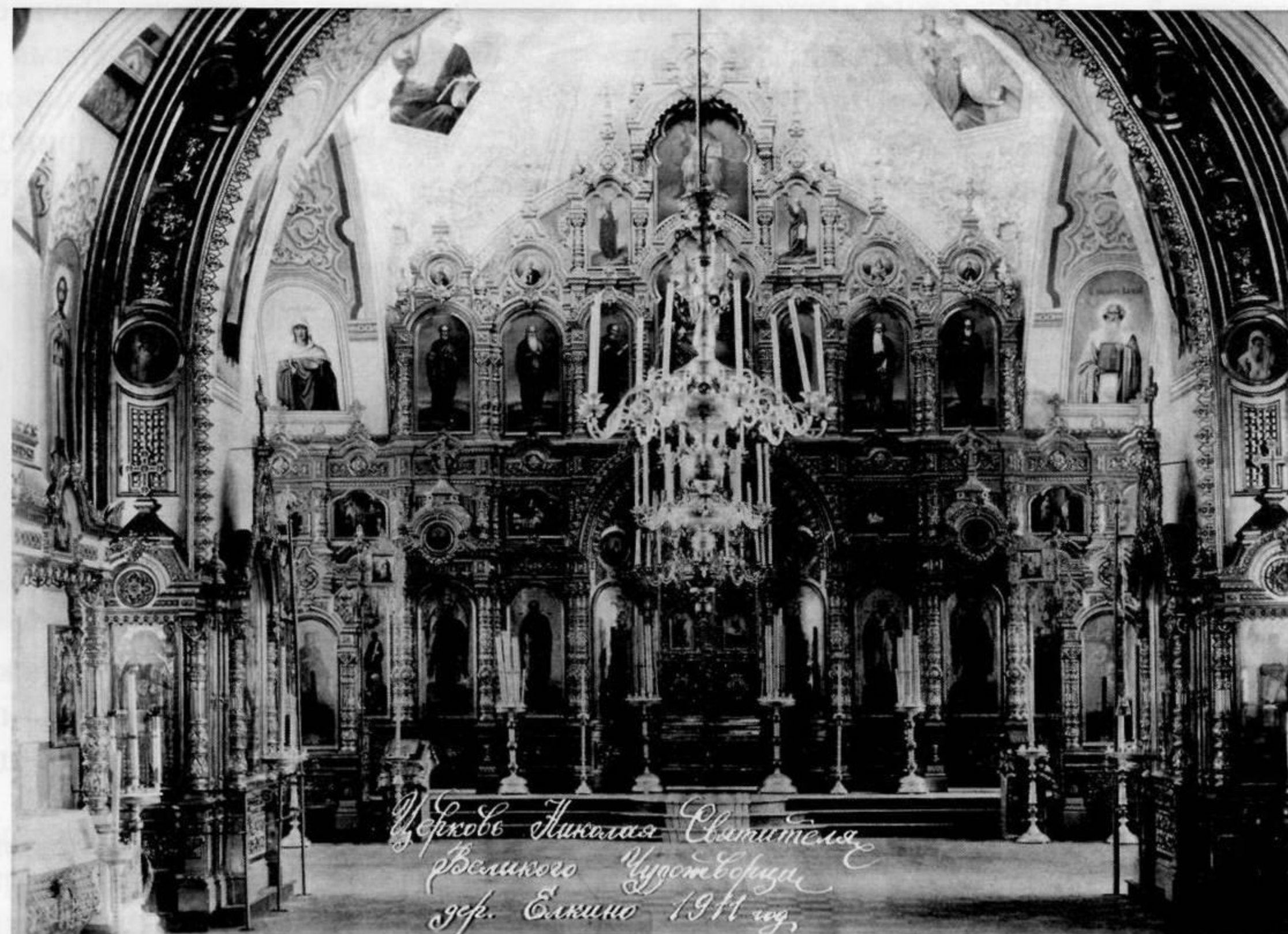
Церковь Николая Великого Чудотворца дер. Ёлкино 1911 год. Иконостас золоченый оценен в 9500 рублей