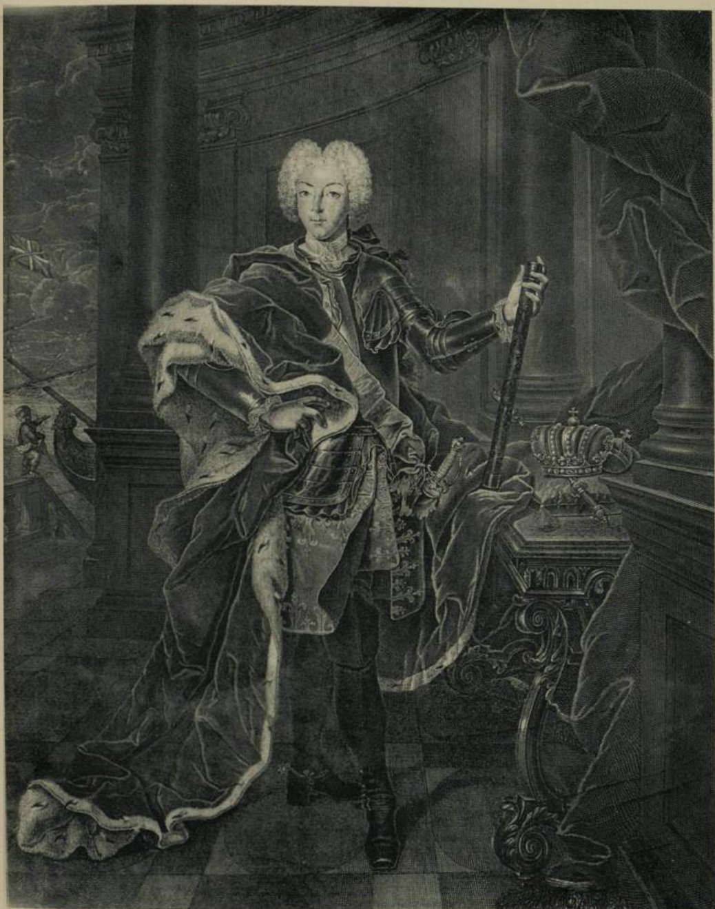
ПЕТРЪ II ИМПЕРАТОРЪ И САМОДЕРЖЕЦЪ ВЪСЕРДССЪЖСЪЖЪЮ Petrus II Imperator totius Russiae