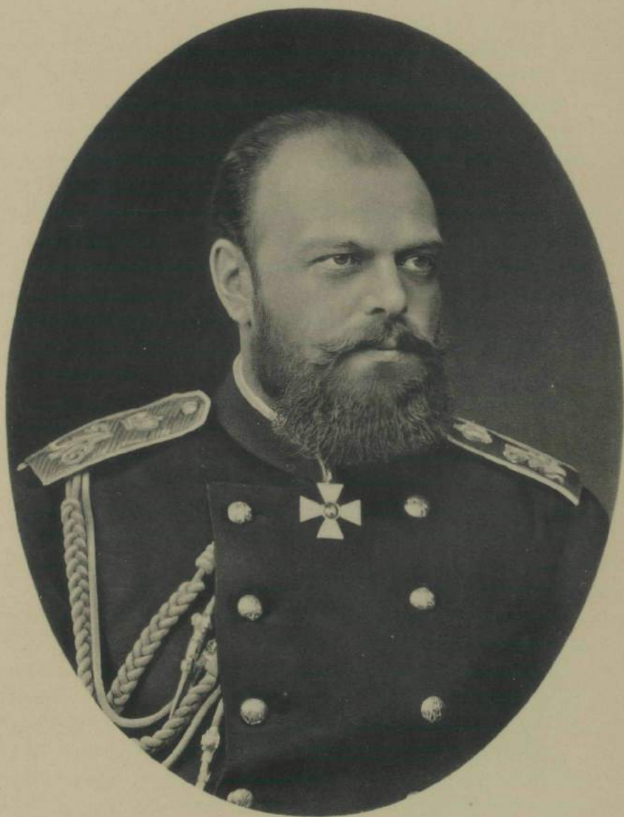
ИМПЕРАТОРЪ АЛЕКСАНДРЪ III.