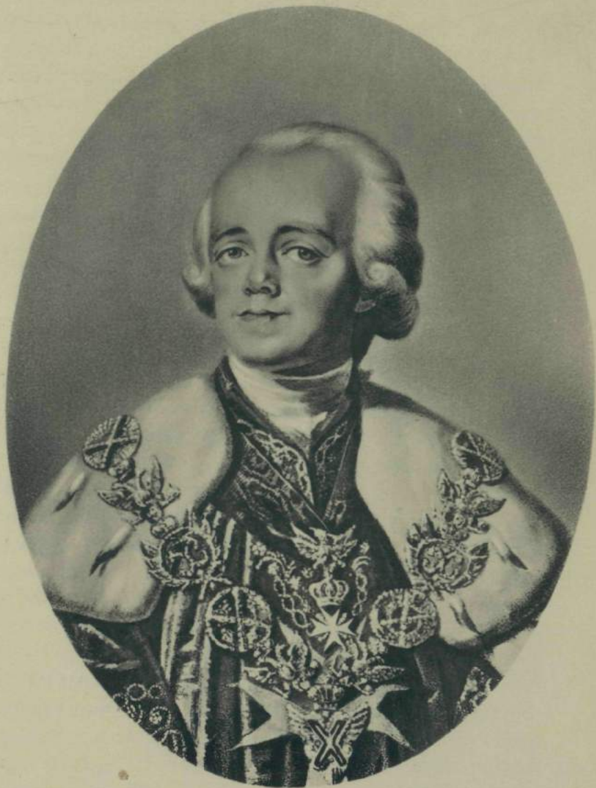
ИМПЕРАТОРЪ ПАВЕЛЪ I.