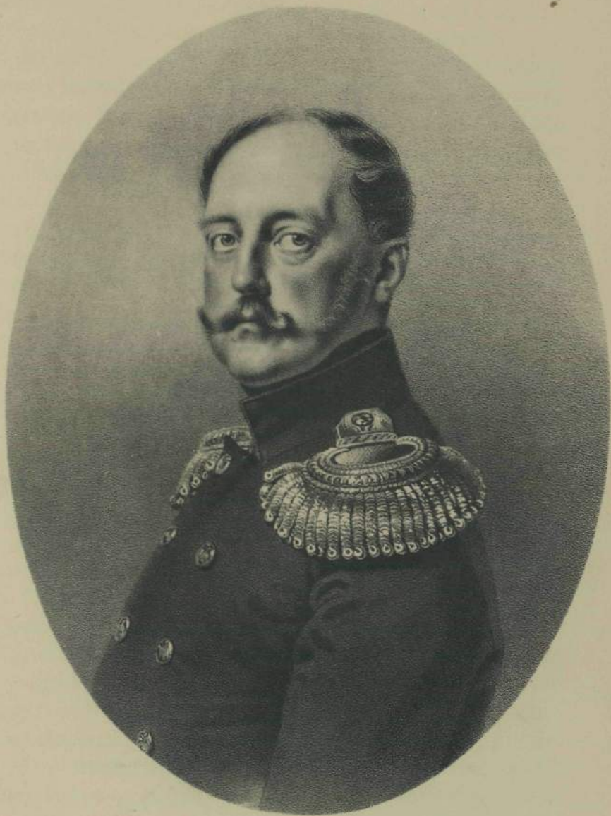
ИМПЕРАТОРЪ НИКОЛАЙ I.