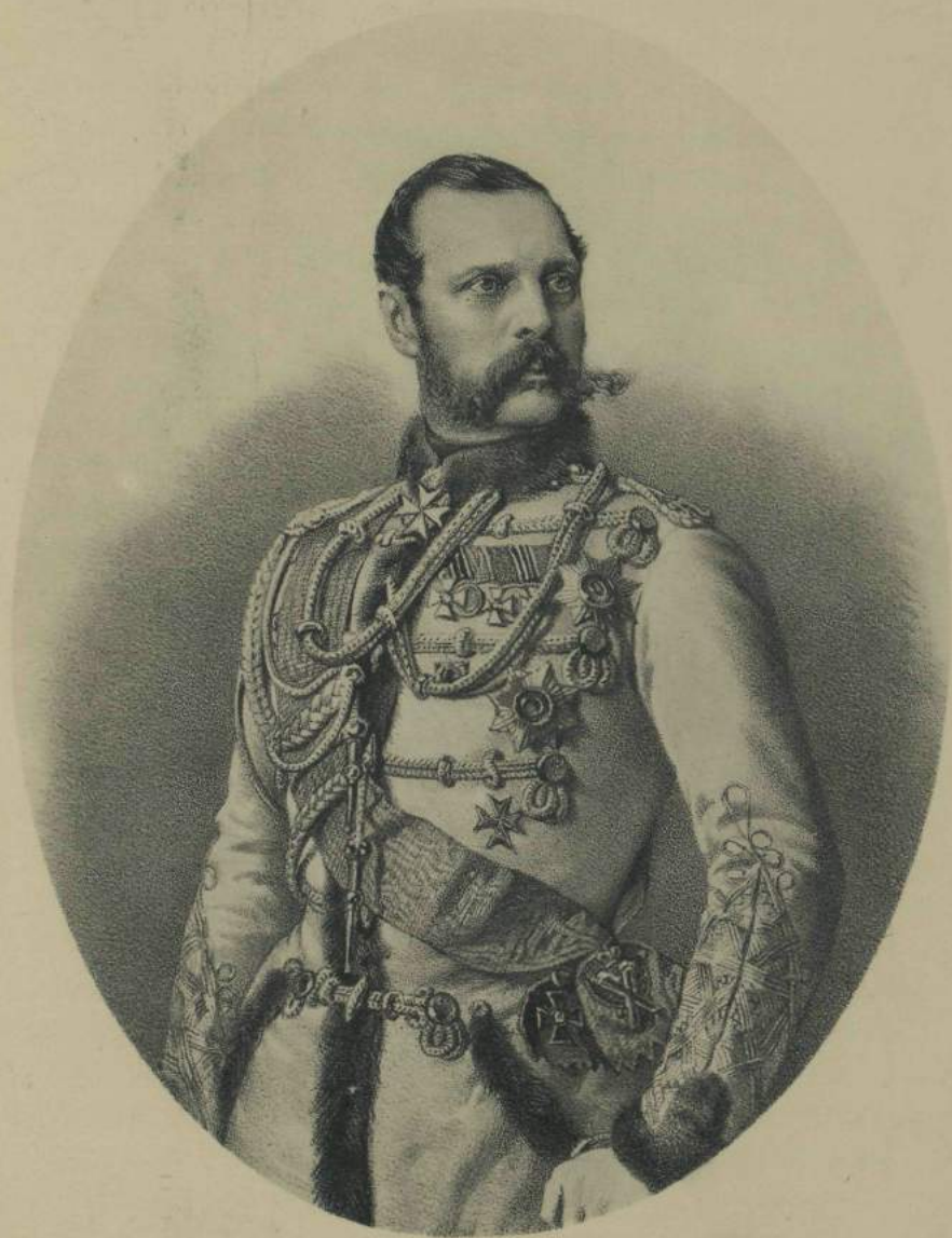
ИМПЕРАТОРЪ АЛЕКСАНДРЪ II.