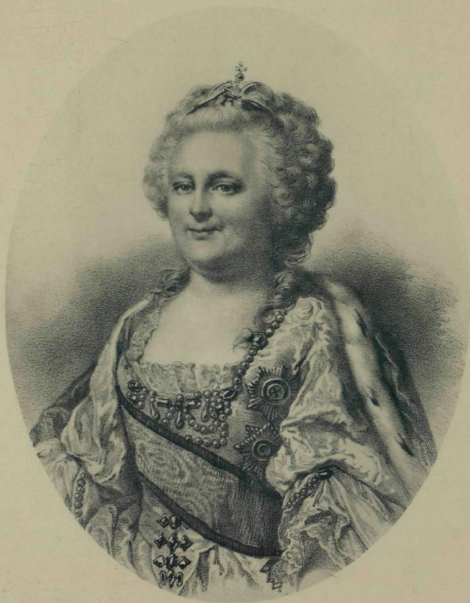
ИМПЕРАТРИЦА ЕКАТЕРИНА II.