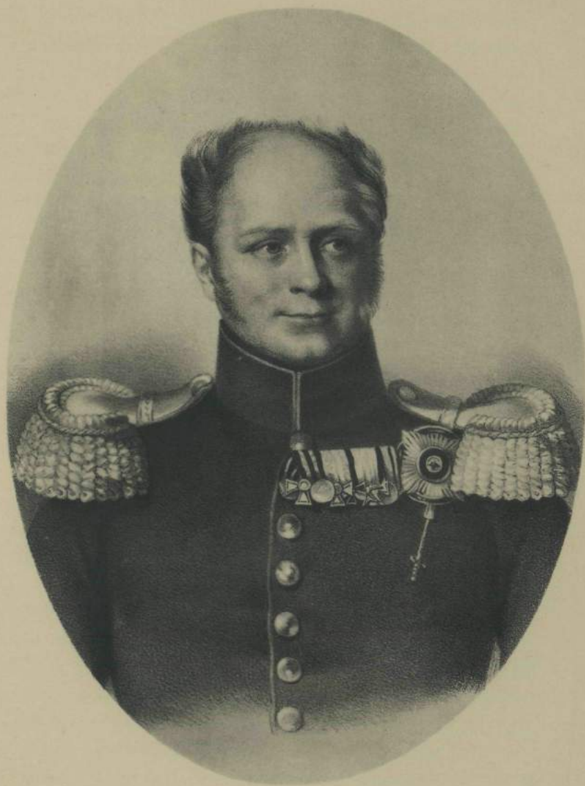
ИМПЕРАТОРЪ АЛЕКСАНДРЪ I.